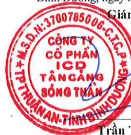
Trần Trí Dũng