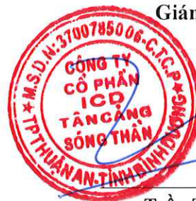
Trần Trí Dũng